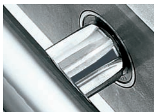
Scorrimento su cuscinetti Running on ball bearings