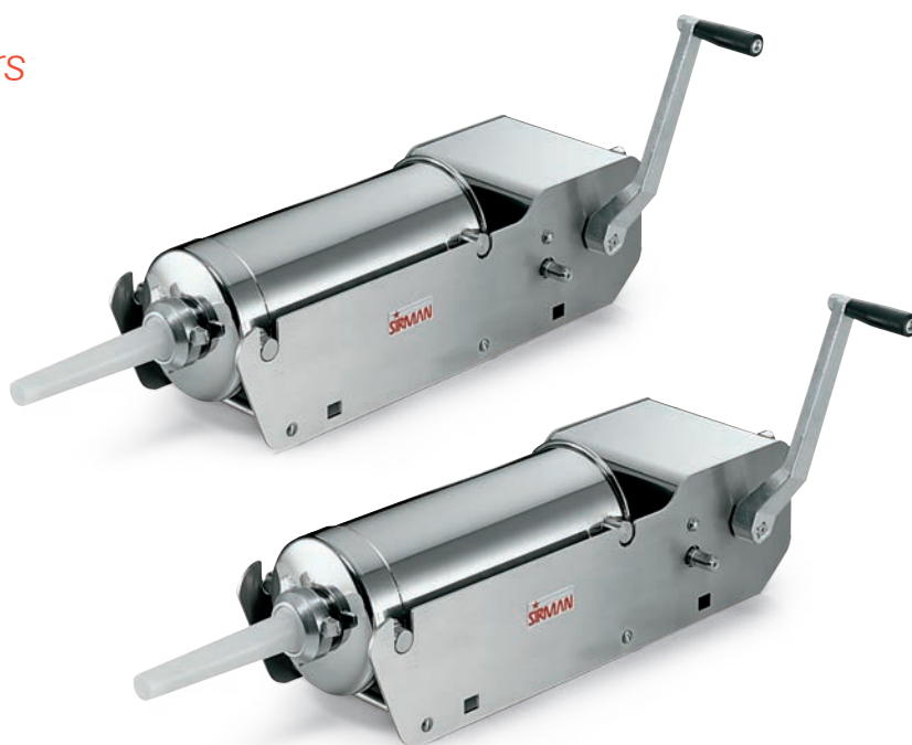
IS 8-16 ARIES